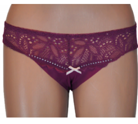
MAJTKI DAMSKIE (S... 3,00 zł