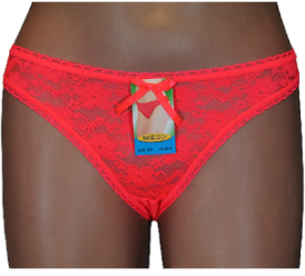
MAJTKI DAMSKIE (S... 3,00 zł