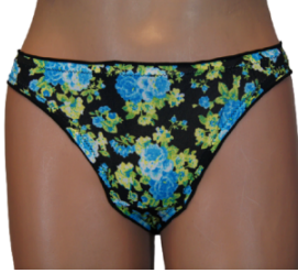
MAJTKI DAMSKIE (S... 3,00 zł