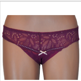
MAJTKI DAMSKIE (S... 3,00 zł