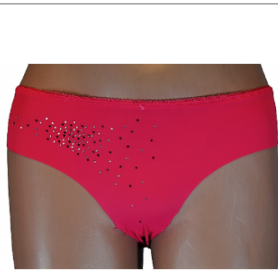
MAJTKI DAMSKIE (S... 4,00 zł