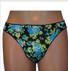
MAJTKI DAMSKIE (S... 3,00 zł