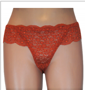
MAJTKI DAMSKIE (S... 3,50 zł