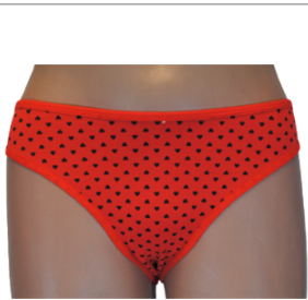
MAJTKI DAMSKIE (S... 3,00 zł