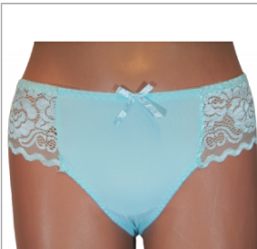
MAJTKI DAMSKIE (S... 4,00 zł