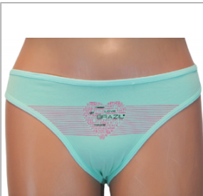
MAJTKI DAMSKIE (S... 3,00 zł