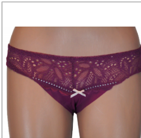
MAJTKI DAMSKIE (S... 3,00 zł